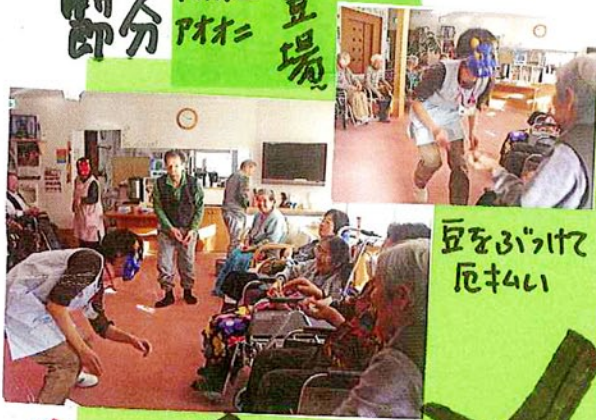
豆をぶつけて 厄払い