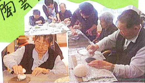
たいてい・こねて・のびしてー